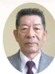
たかはら森林組合 代表理事組合長