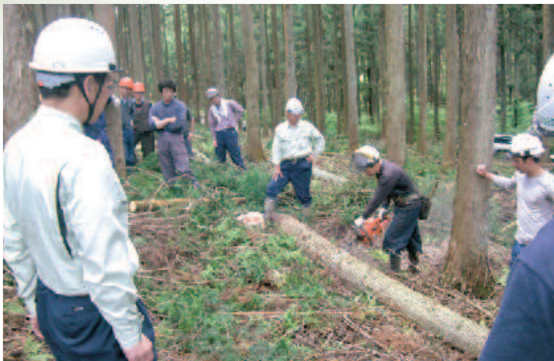
伐倒と造材の講習会