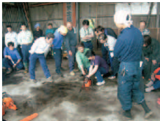
刈り払い機・チェーンソーの調整講習会