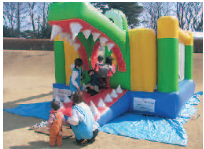
アリゲーターバウンズ