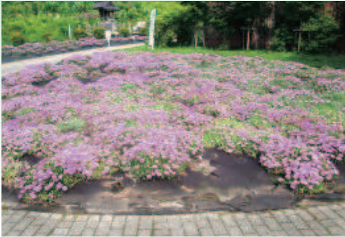
見ごろを迎え咲き誇る松葉菊