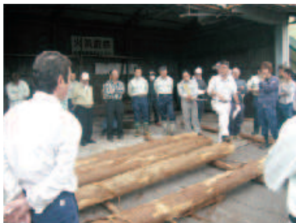
出荷材単価検討会