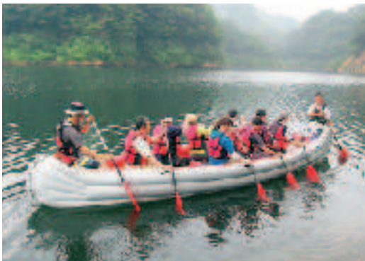
カヤック体験ツアー 10月1日再開