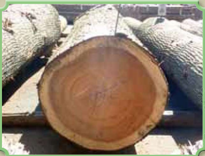
関東森林管理局局長賞